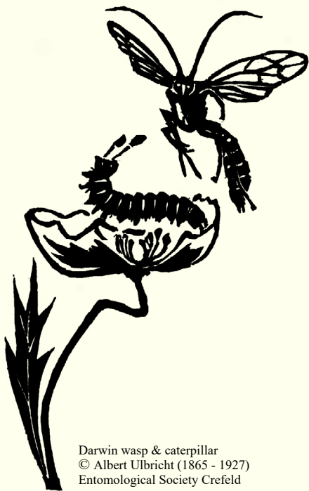
Darwin wasp & caterpillar